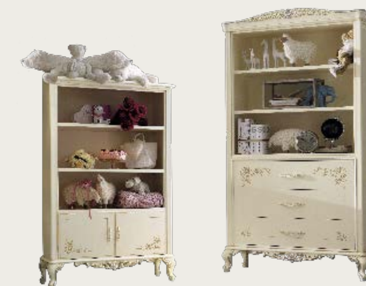
art. 18 C

Cassettiera · Drawers L. 83 P. 49 H. 137