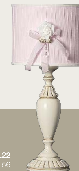
art. L22 Ø 25,5 H. 56