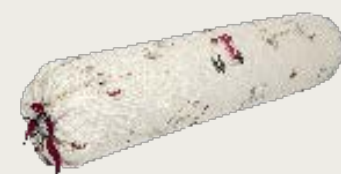
art. A13 L. 100 Ø 20