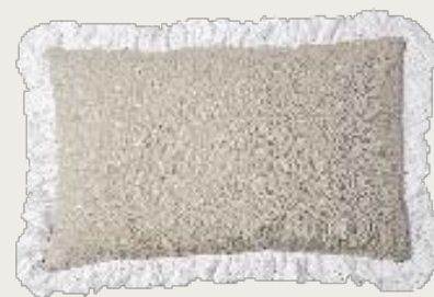
art. A23 88 x 60