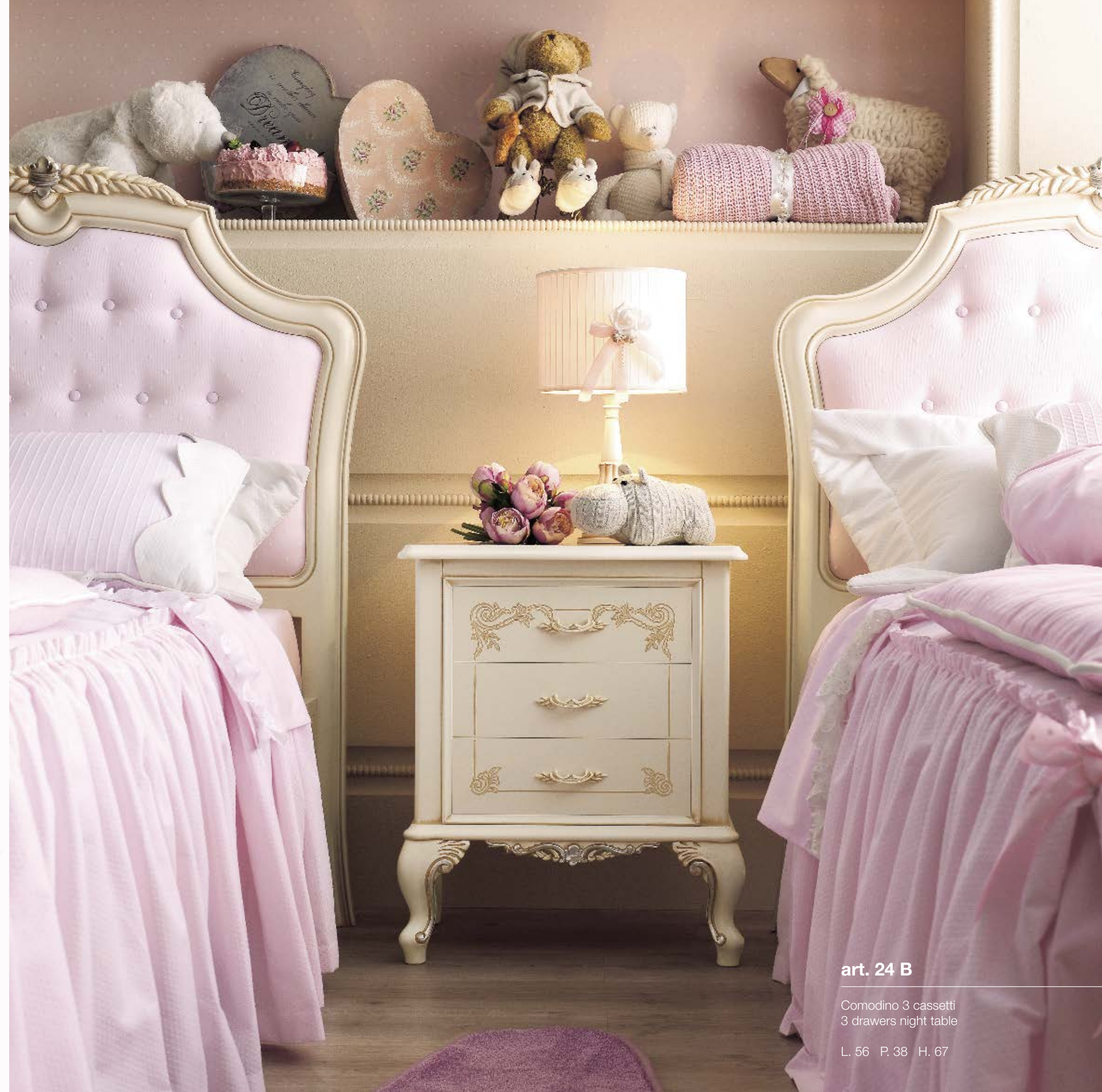
art. 24 B

Comodino 3 cassetti 3 drawers night table