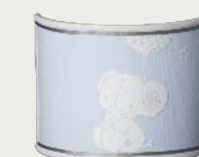
art. L9 25,5 x 20