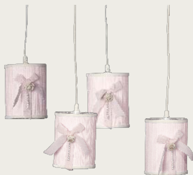
art. L2 Ø 12,5 H. 16