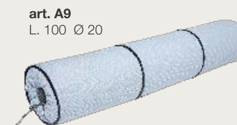
art. A9 L. 100 Ø 20