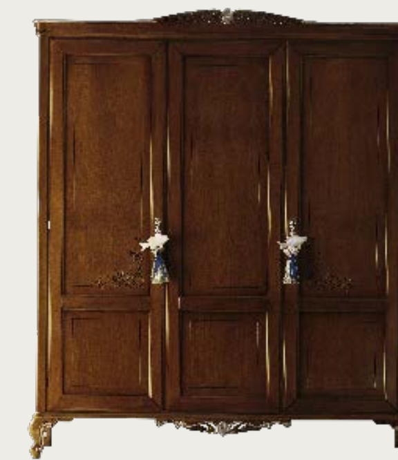
art. 22 F

Armadio 2 ante · 2 doors wardrobe L. 126 P. 61 H. 213