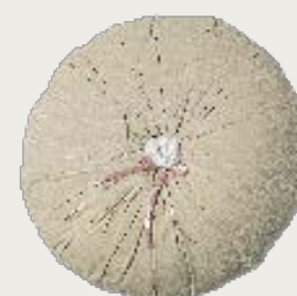
art. A26 Ø 60