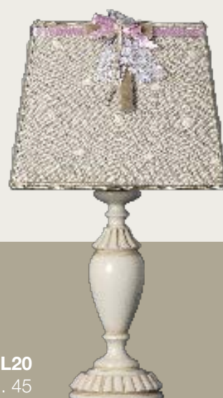
art. L20 25 x 25 H. 45