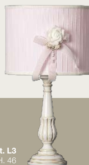
art. L3 Ø 25,5 H. 46