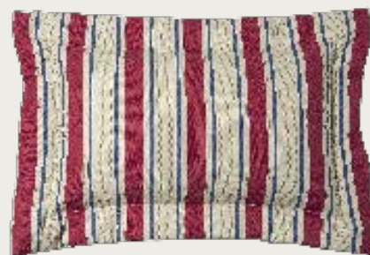
art. A14 98 x 68