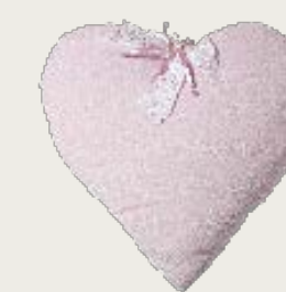
art. A22 60 x 65