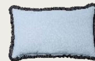
art. A7 83 x 52