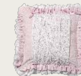
art. A25 50 x 50