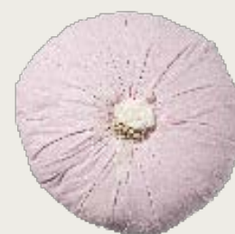
art. A5 Ø 60