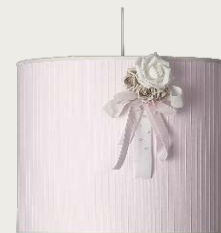
art. L21 Ø 50 H. 40