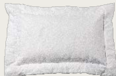
art. A3 96 x 68