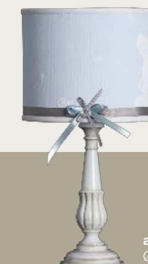
art. L8 Ø 25 H. 46