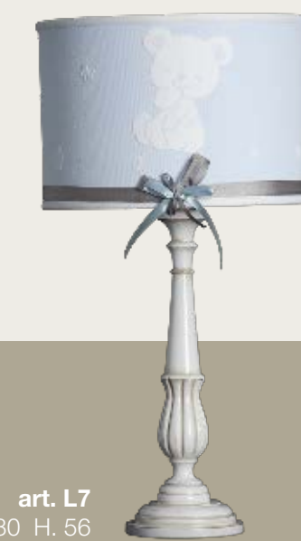
art. L7 Ø 30 H. 56