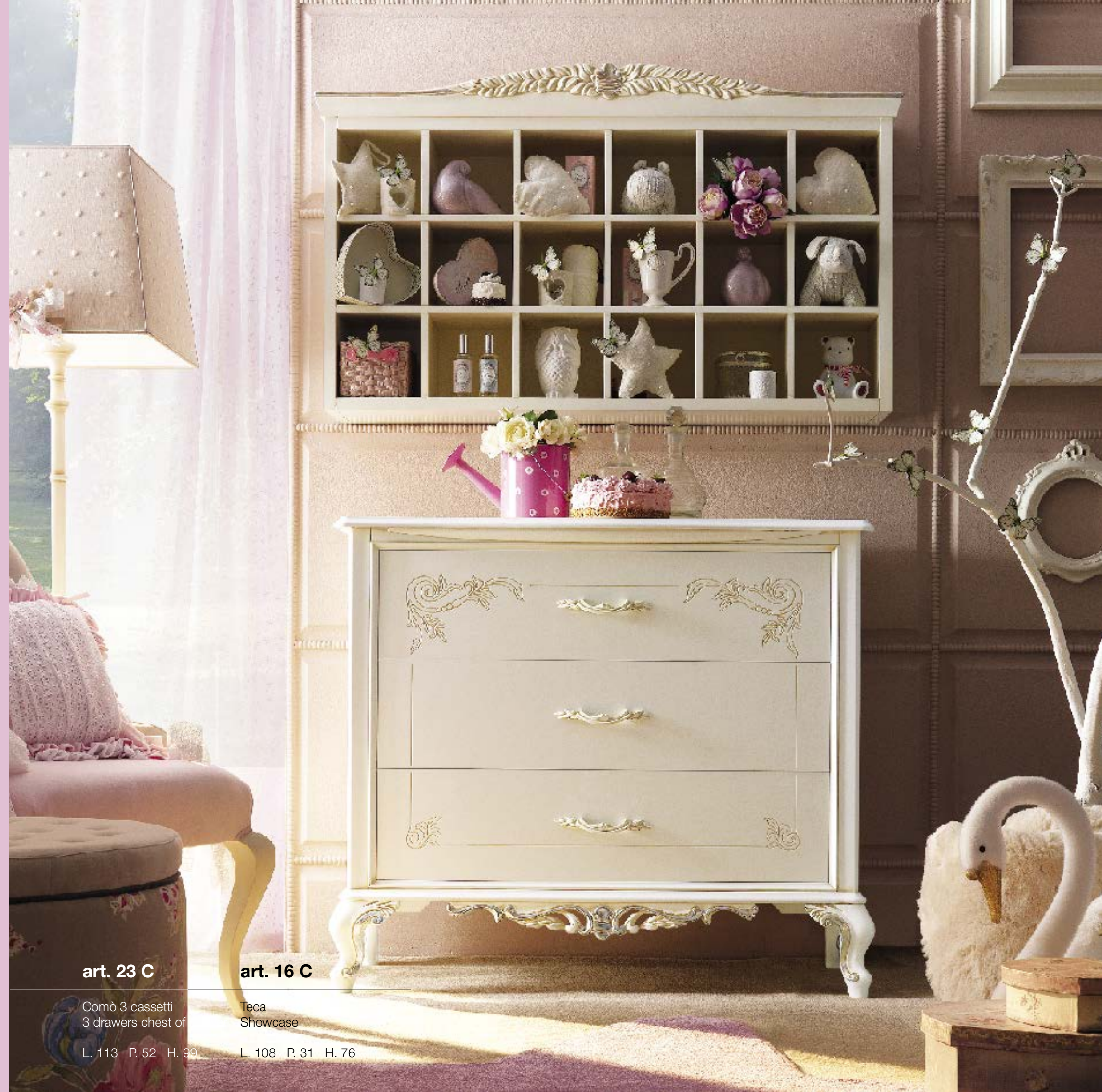
art. 23 C