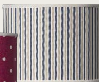
art. L13 Ø 25,5 H. 56