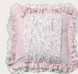
art. A25 50 x 50