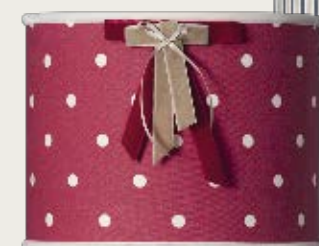
art. L12 Ø 25,5 H. 45