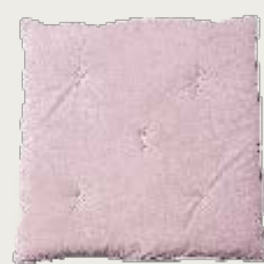
art. A2 90 x 90