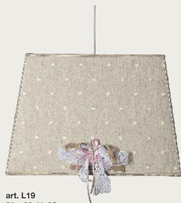
art. L19 50 x 50 H. 35