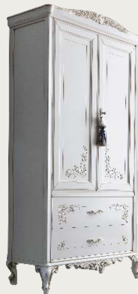
art. 20 B

Letto tessuto K55 · Bed fabric K55 L. 142 P. 210 H. 138 - (120 x 200)