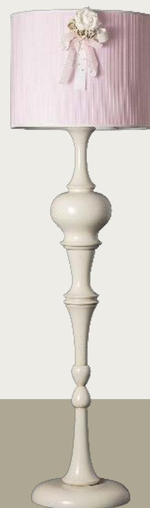
art. L1 Ø 50 H. 175