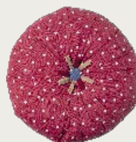
art. A16 Ø 60