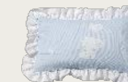
art. A11 60 x 37