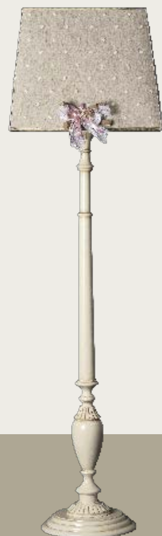
art. L18 50 x 50 H. 175