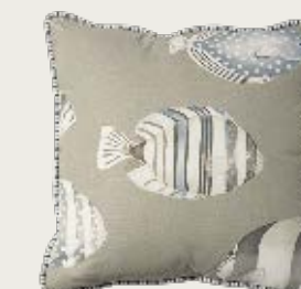
art. A20 48 x 48