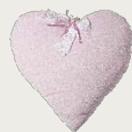
art. A22 60 x 65