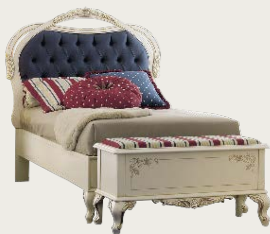
art. 12 C

Letto tessuto K53 · Bed fabric K53 L. 129 P. 210 H. 140 - (100 x 200)