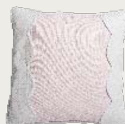
art. A4 48 x 48