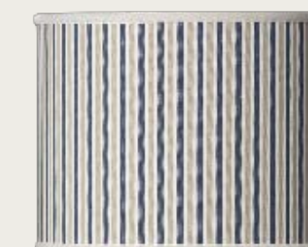
art. L16 Ø 25,5 H. 56