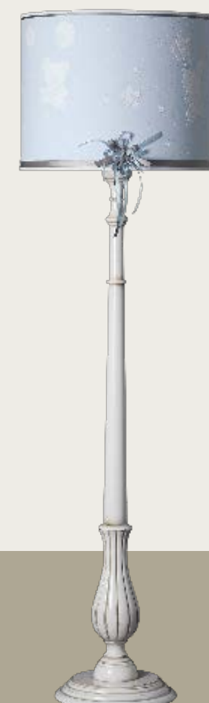
art. L5 Ø 50 H. 178