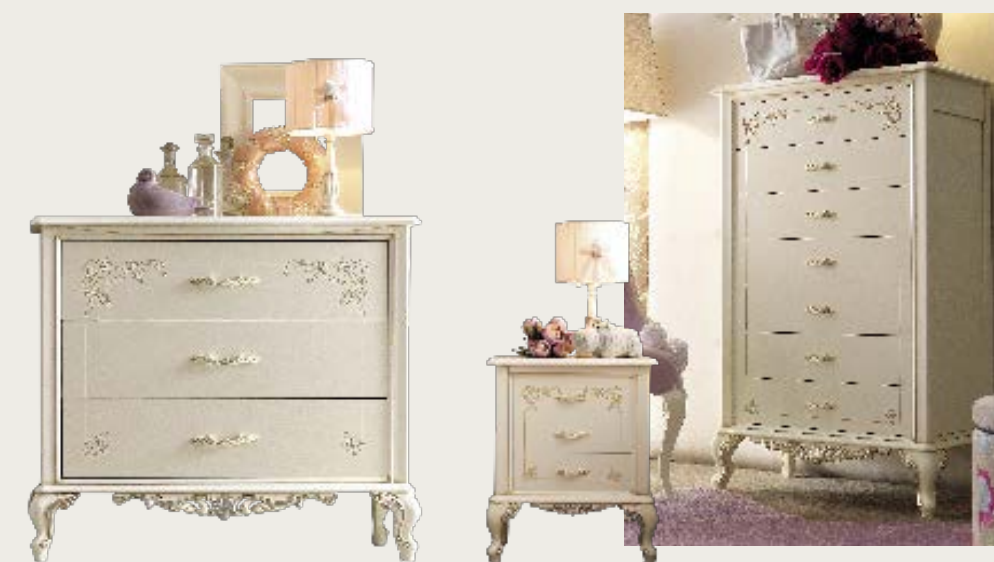
art. 23 C

Armadio 3 ante · 3 doors wardrobe L. 184 P. 61 H. 213