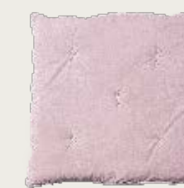
art. A2 90 x 90