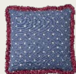
art. A15 53 x 53