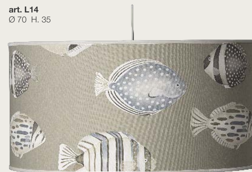
art. L14 Ø 70 H. 35