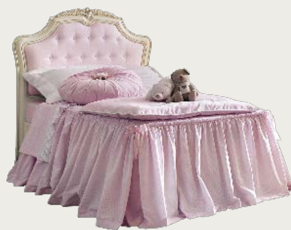
art. 14 C

Letto tessuto K53 · Bed fabric K53 L. 129 P. 210 H. 140 - (100 x 200)