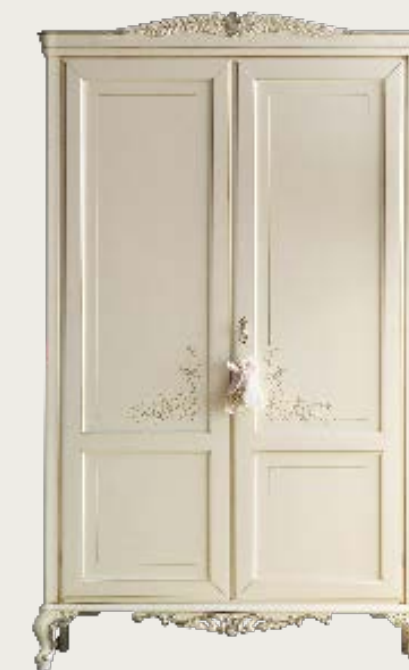
art. 21 C

Armadio 2 ante 2 cassetti 2 doors wardrobe with 2 drawers L. 113 P. 49 H. 213