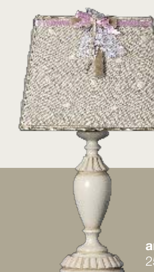
art. L20 25 x 25 H. 45