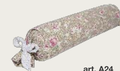
art. A24 L. 110 Ø 20