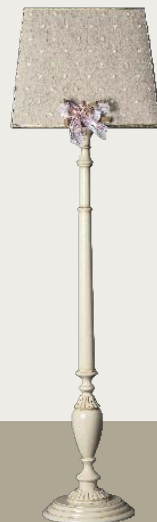
art. L18 50 x 50 H. 175