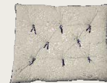
art. A18 105 x 84