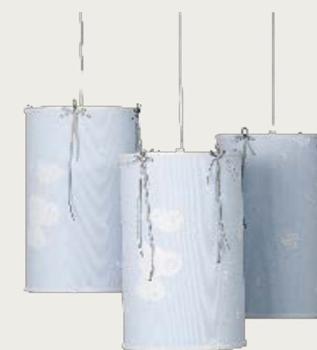
art. L6 Ø 25,5 H. 40