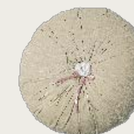
art. A26 Ø 60