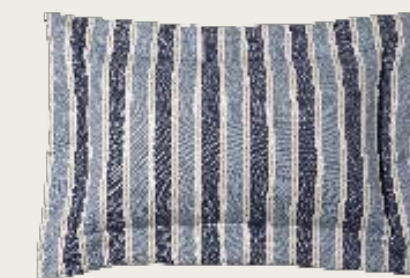
art. A19 98 x 68