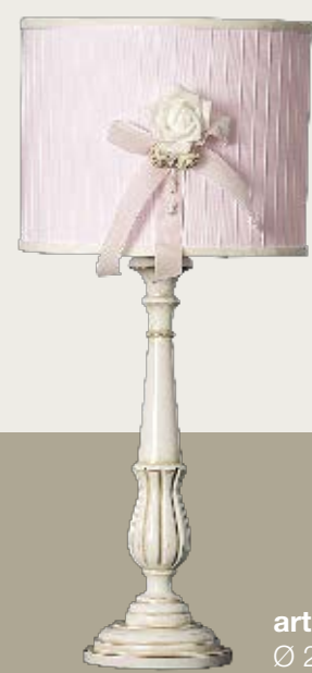
art. L4 Ø 25,5 H. 55