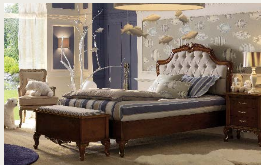
art. 15 F

Letto tessuto K52 · Bed fabric K52 L. 155 P. 225 H. 137 - (120 x 200)