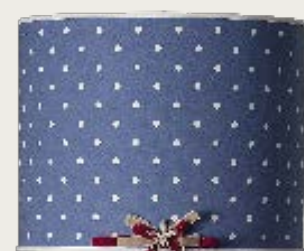
art. L11 Ø 70 H. 35