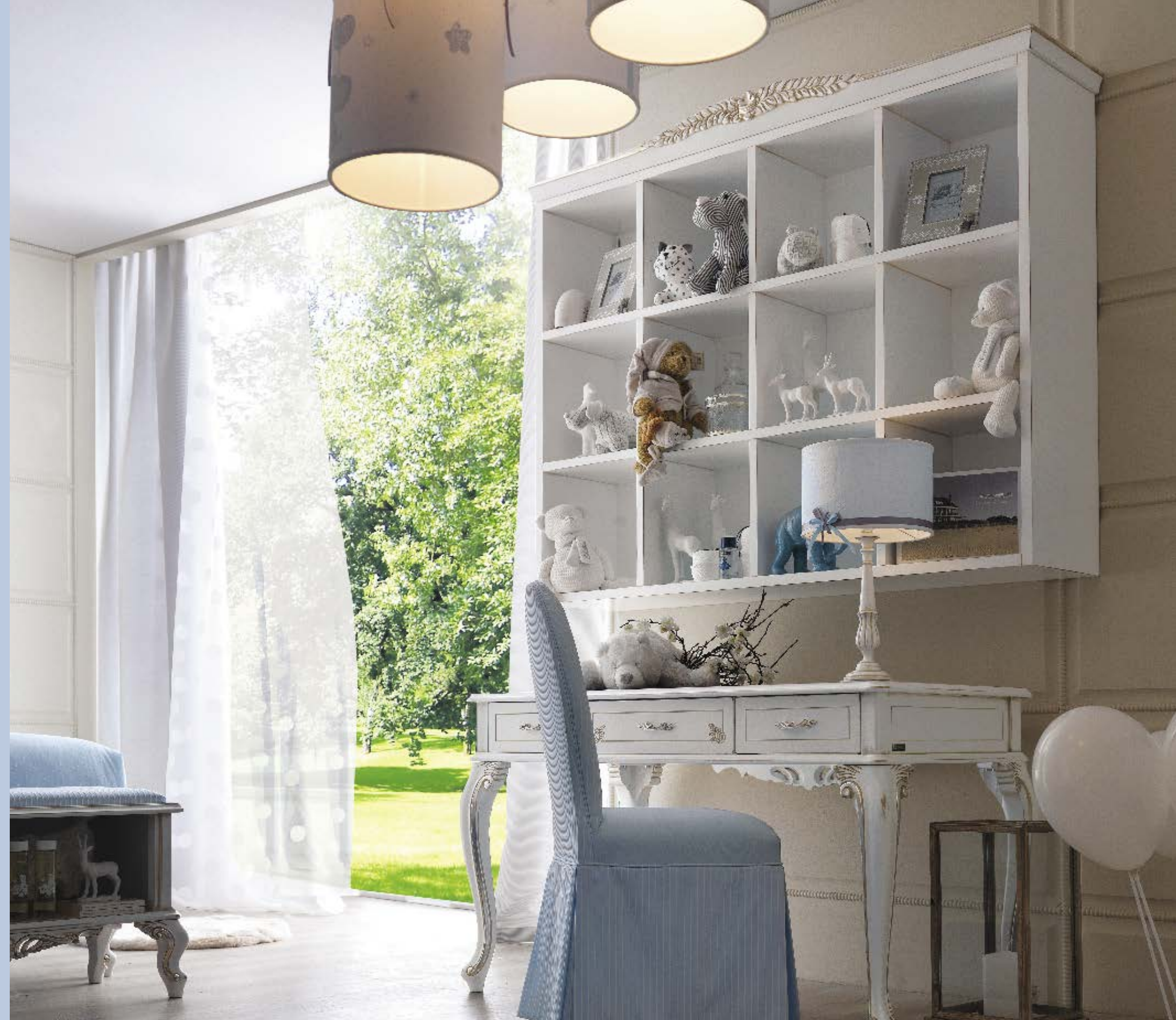
art. 17 B