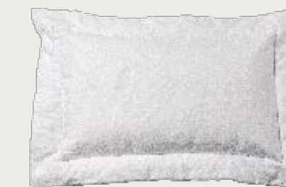
art. A3 96 x 68