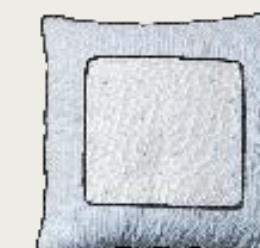
art. A10 60 x 60