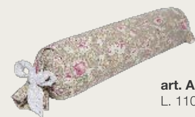
art. A24 L. 110 Ø 20