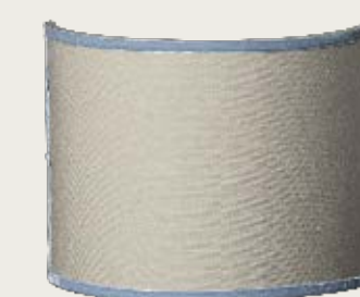
art. L15 25,5 x 20