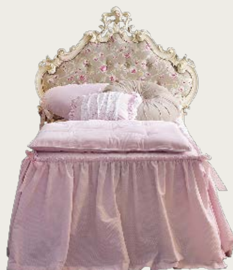
art. 11 C

Letto tessuto K50 · Bed fabric K50 L. 113 P. 212 H. 135 - (90 x 200)