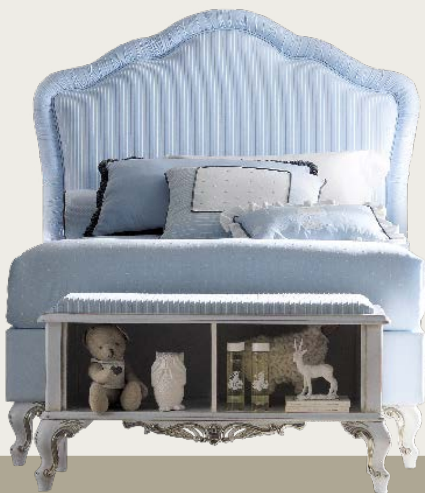
art. 13 B

Letto tessuto K57 · Bed fabric K57 L. 123 P. 212 H. 142 - (100 x 200)